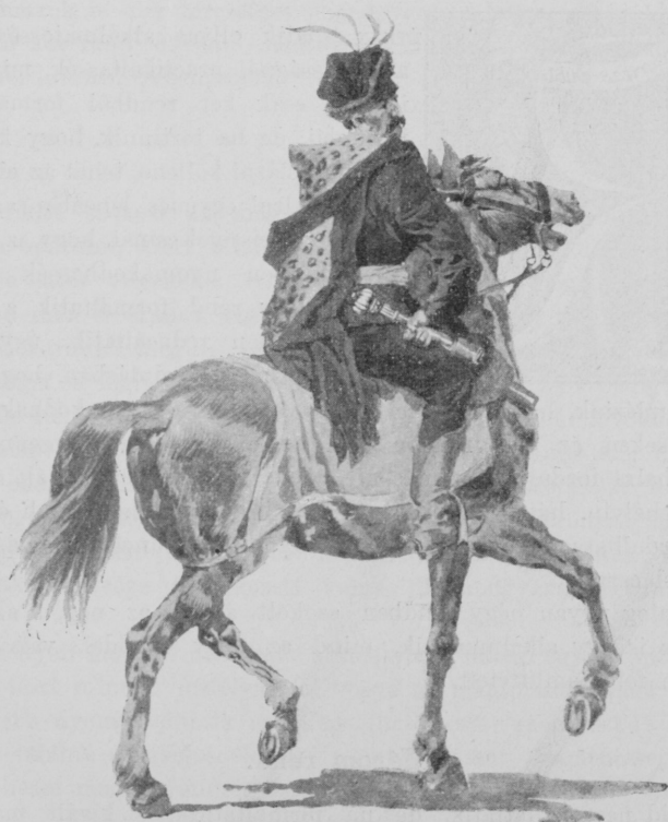
Magyar huszártiszt a XVII-ik századból.