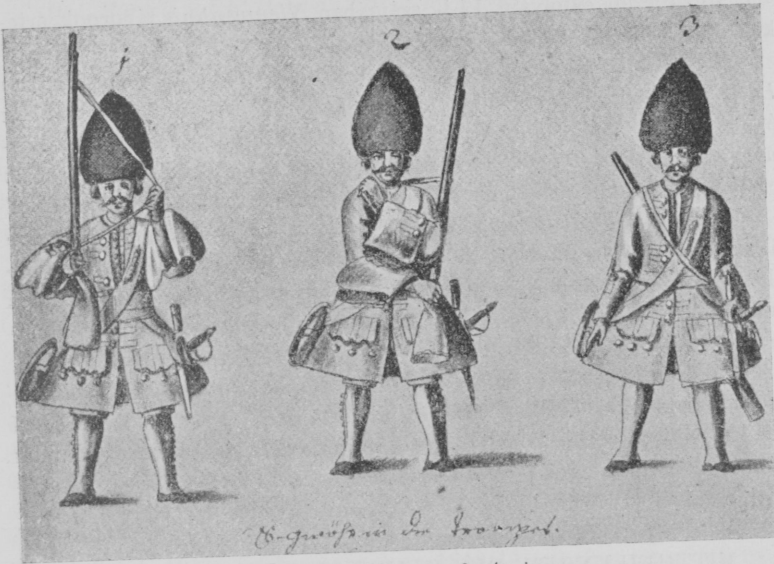
Grenadiere der Kaiserl. Armee. Gránátosok fegyverfogásai.