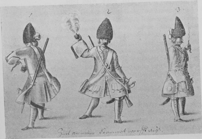
Die Grenadiere der Kaiserl. Armee. Gránát dobás.