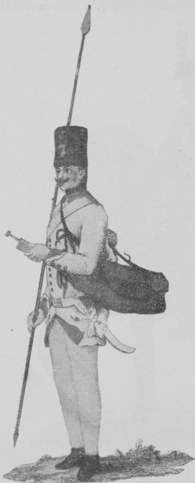
Határőrvidéki lövész 1794-ből

A huszárok öltözete a fekete nemezből készült, hengerded, kuru- ezos formájú, sárga paszománttal szegett, elül rézrózsával, sárga-fekete