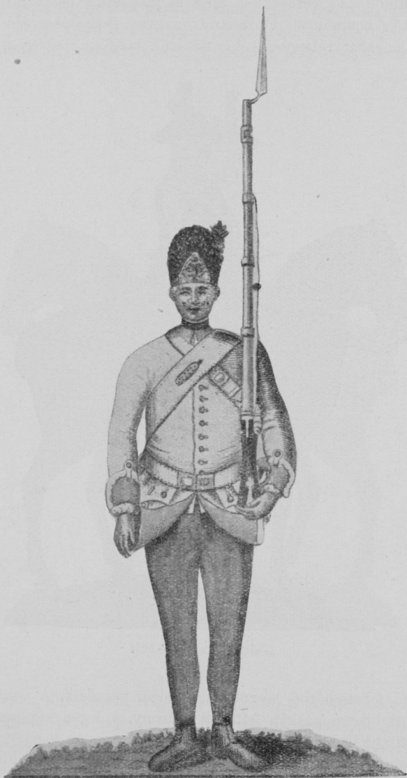
Magyar gránátos 1779-ből.