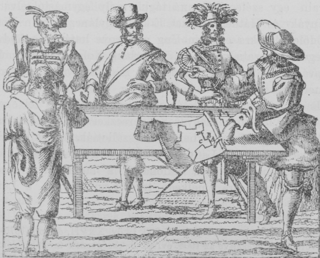
Európai hadi tanács; a jobb oldalon egy magyar kapitány képével, 1672-ből.

2 Dilbaum budai látképe magyarázó sorai szerint, a miről bővebben Gall és Bonhomo haditanácsosok 1602 október 8-ikán a következőket írták a budai táborból Mátyás főhercegnek: Die Stadt Pest ist dreimal so gross als Pressburg und mit starken Rundeln und ein Gemauer von Quaderstück gebaut. (Eredetije a bécsi állami levéltár Hungarica osztályában.)