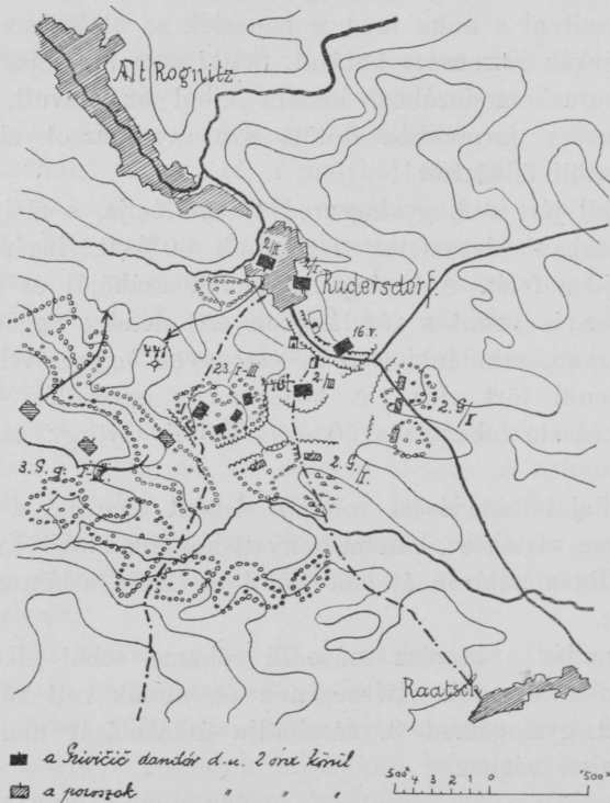
2. vázlat. A rudersdorfi ütközet.

«A dandár Alt-Rognitzon át Raatschra menetel s itt Eipel felé vagy mint elővéd foglal állást, vagy az esetleg Kaile felé előnyomuló ellenség oldalába támad.»