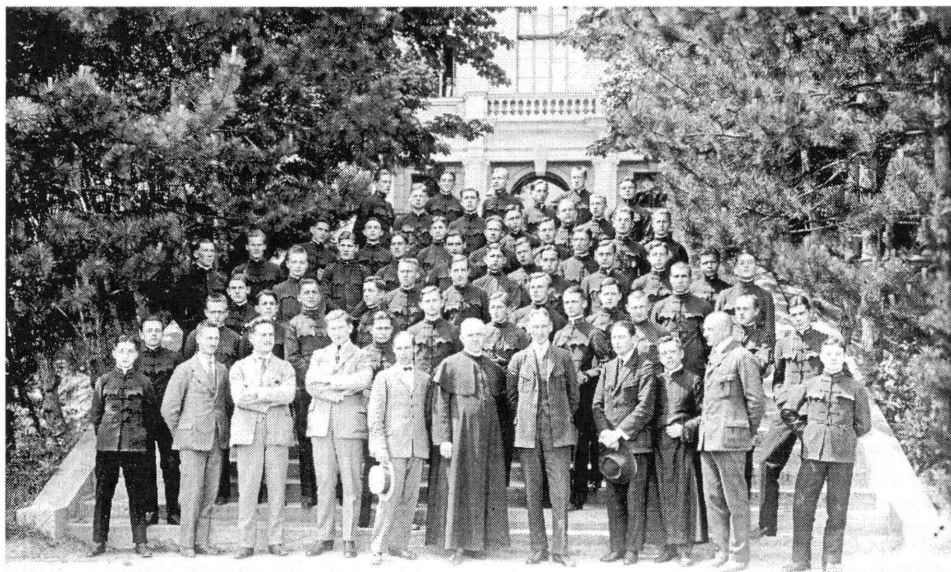
A M. Kir. „Bocskai István” Katonai Főreáliskola növendékei (1926?)

A VKM és a HM együttműködése, a kétféle nevelési irány összehangolása tehát nem volt felhőtlen. A „civil beavatkozást” nehezen fogadták el a haderőben. 22 A kényszer-szimbiózistól azonban a húszas években még nem lehetett szabadulni. A trianoni diktátum súlya alatt, az irredenta közhangulattal és revíziós vággyal áthatott, harmadára csökkent országban, közvetlenül a háború utáni években a katonai szempontok, a haderőfejlesztés szóba sem kerülhettek. Helyettük – mint ahogy a régió más országaiban is – „a szellemi és erkölcsi túlsúly növelésének” programja kínálkozott. „A magyar hazát ma nem a kard, hanem a kultúra tarthatja meg és teheti naggyá” – fogalmazta meg a kultuskormányzat az erőgyűjtés időszakának reális programját. 23 Az 1920-as években Klebelsberg Kuno gróf, vallás- és közoktatásügyi miniszter (1922–1931) „kultúrfőlény” koncepciója szervesen egészítette ki Bethlen István gróf, miniszterelnök (1921–1931) gazdasági és politikai konszolidációját. 24 „Szeretném a köztudatba átvinni – érvelt 1925-ben költségvetési beszédében a katonacsaládból származó miniszter –, hogy a trianoni béke következtében lefegyverzett Magyarországon a kultuszárca voltaképpen a honvédelmi tárca is.” 25