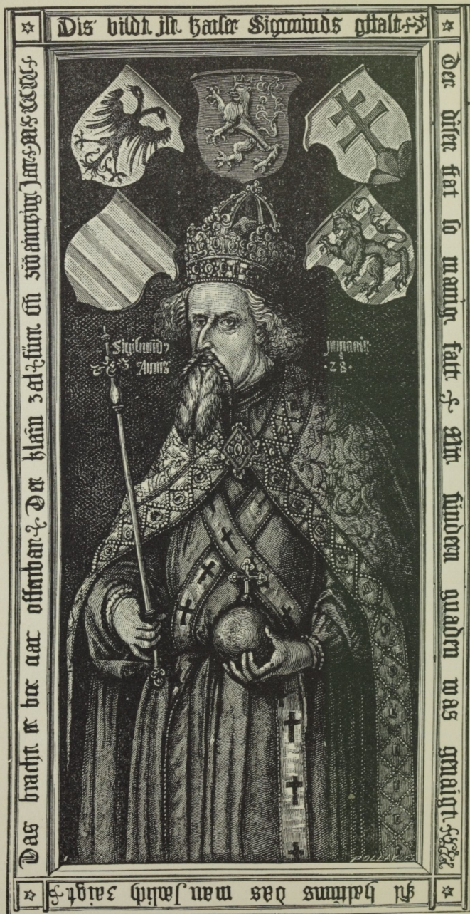
ZSIGMOND CSÁSZÁR ÉS KIRÁLY.