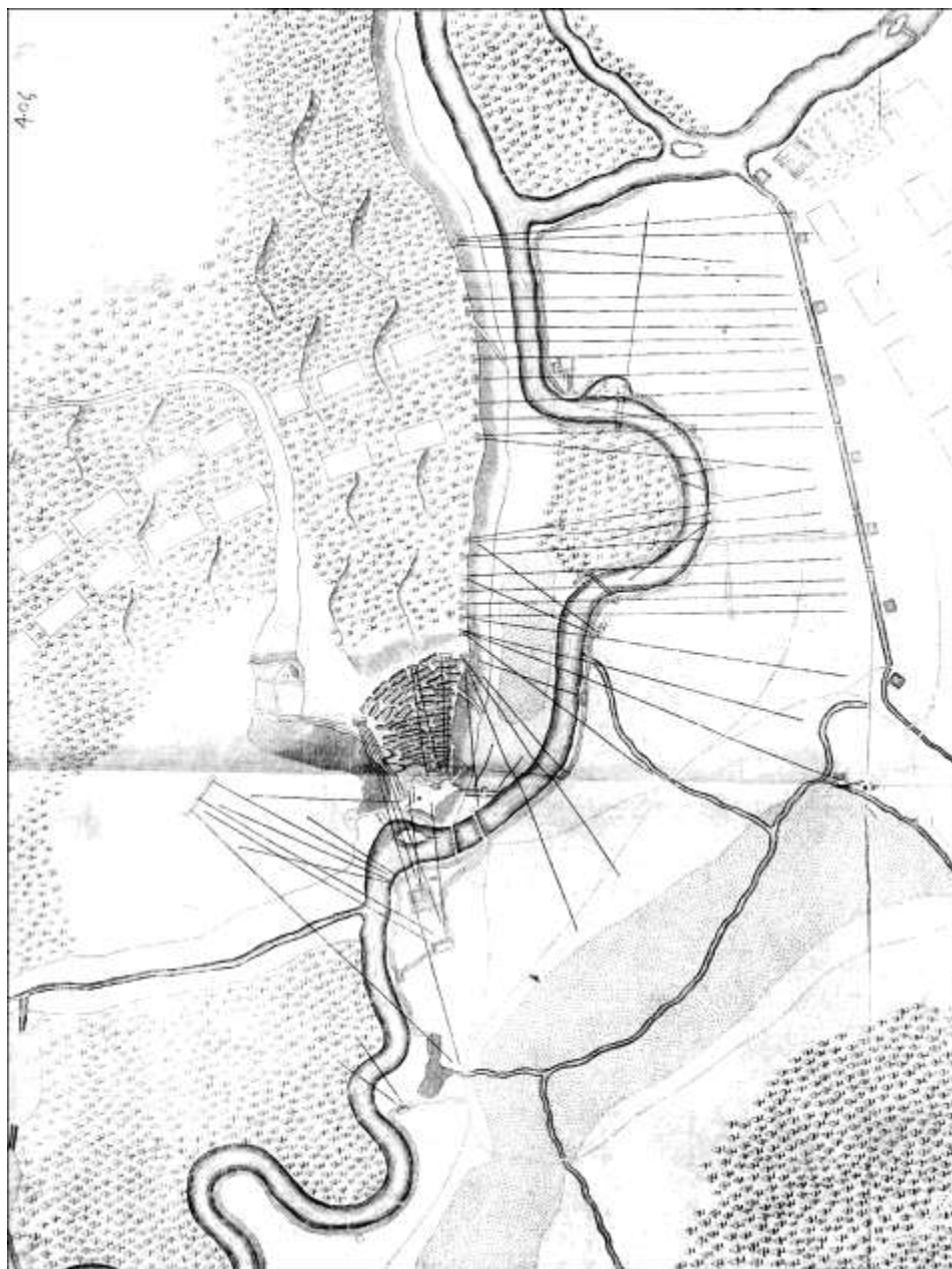
4. kép – Gualdo Priorato