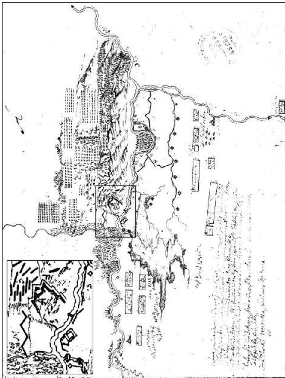
1. kép. Montecuccoli vázlata; a jobb felső sarokban a vár kinagyított rajza