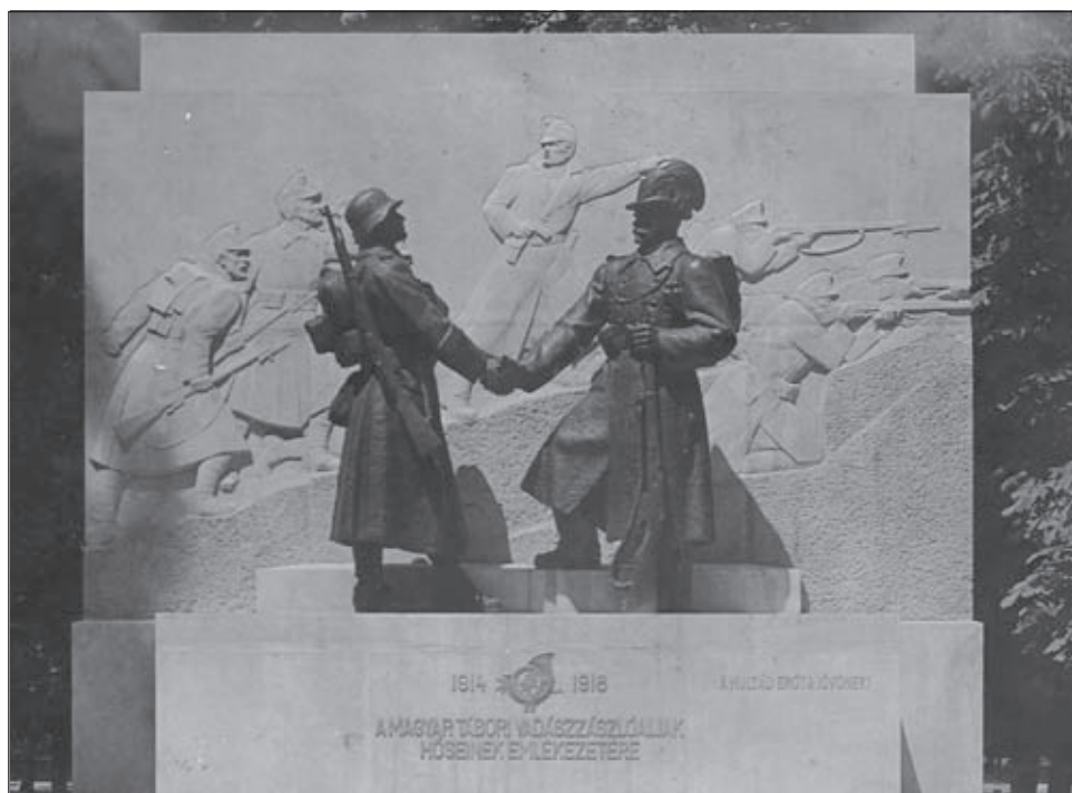
A városmajori emlékmű a felavatás után (archív) Göcseji Múzeum