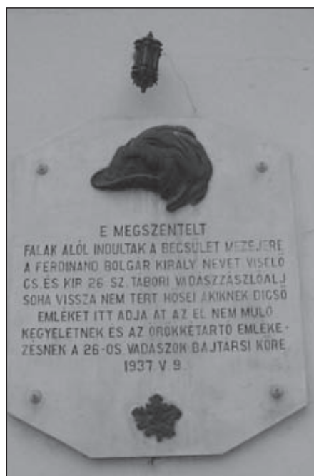
Nagyitényeni emléktábla (26. zlj.)