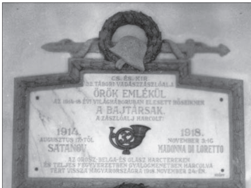
Emléktábla a Hadimúzeumban (32. zlj.)