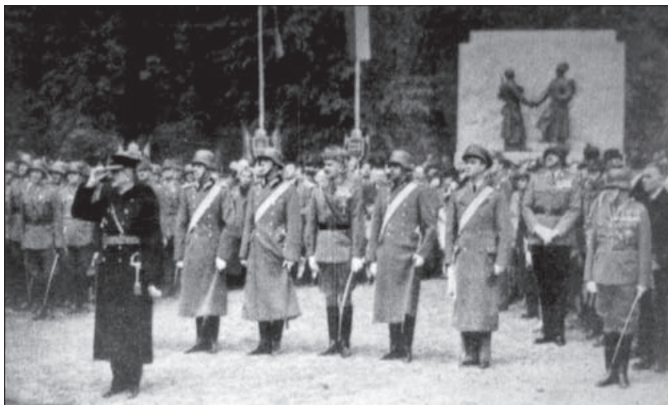
A magyar tábori vadászsászlóaljak városmajori emlékművének avatása, archív