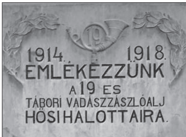
Tatai emléktábla (19. zlj.). A szerző felvétele