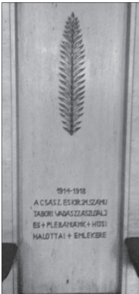
Hősök kápolnája a Budapest városmajori plébániatemplomban (24. zlj.).