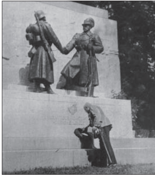
A városmajori emlékmű koszorúzása 1942-ben, archív