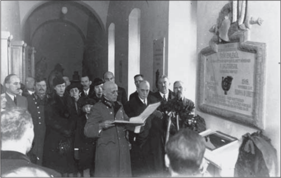
A 32. vadászászlóalj emléktáblájának avatása, a Halmy család engedélyével