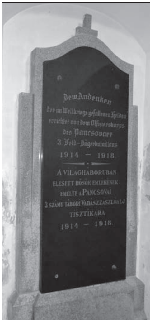
Emléktábla a pancsovai templomban (3. zlj.).