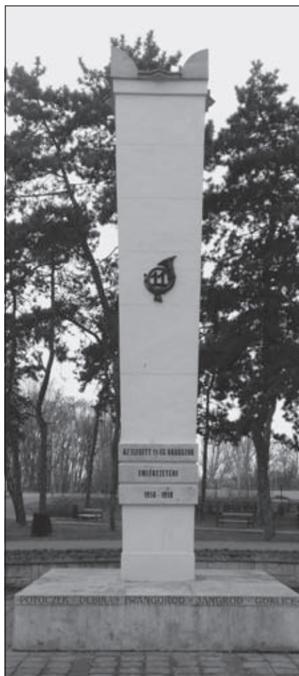
A győri emlékmű (11. zlj.).