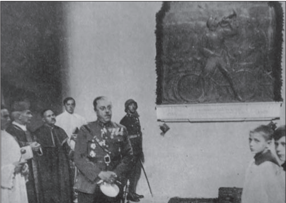
A Kerékpáros emléktábla avatása a Helyőrségi templomban, archív