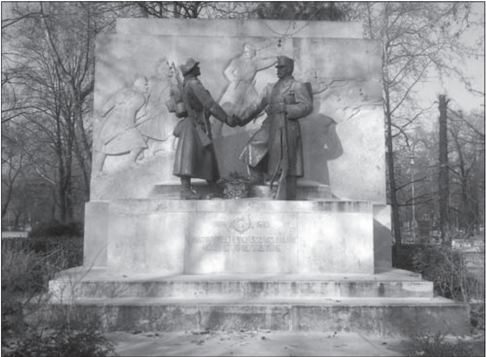
A városmajori emlékmű napjainkban.