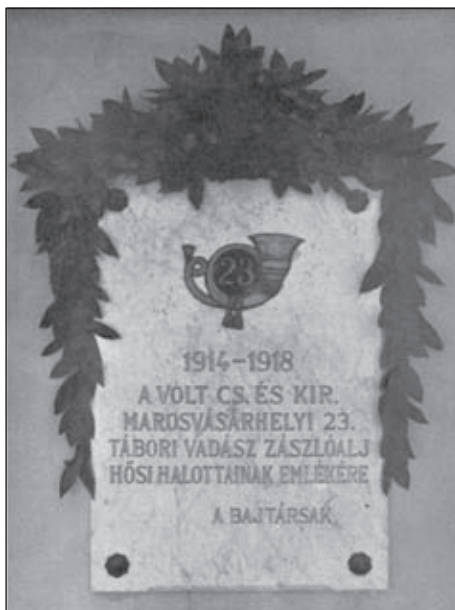
Emléktábla a Hadimúzeumban (23. zlj.), archív