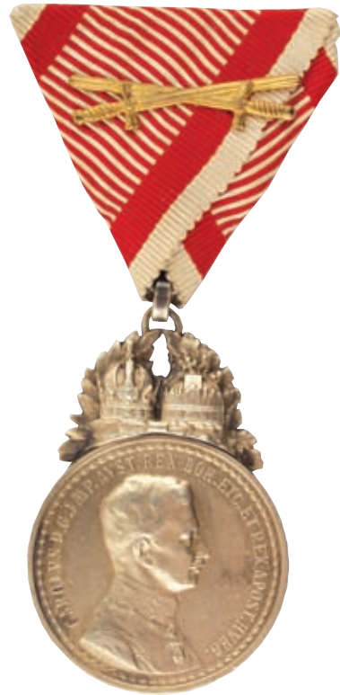
Nagy Katonai Érdemérem hadiszalagon, kardokkal Arz Arthur vezérezredes hagyatékából (HIM Numizmatikai Gyűjtemény)