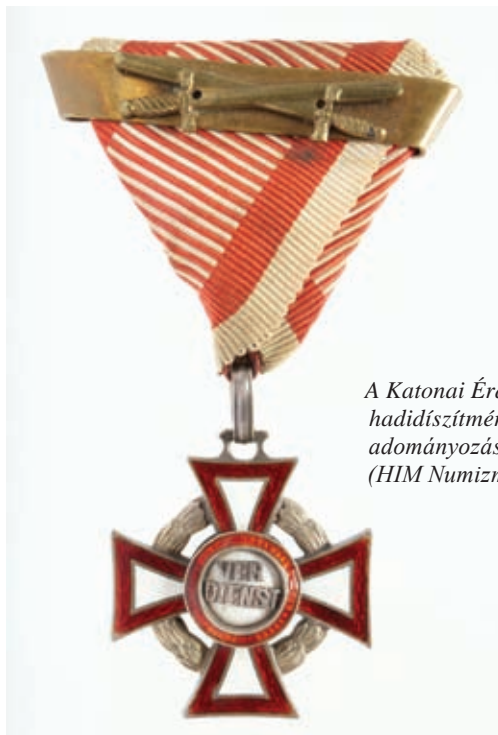
A Katonai Érdemkereszt III. osztálya hadidíszítménnyel, kardokkal, másodszori adományozást jelölő pánttal (HIM Numizmatikai Gyűjtemény)