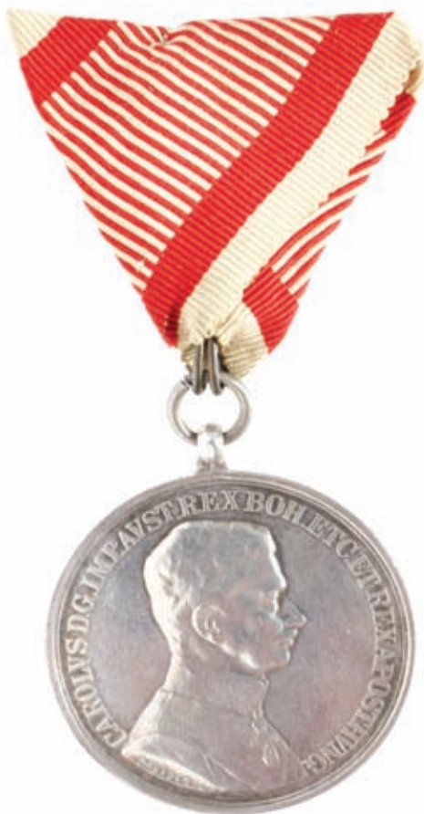
Ezüst Vitézségi Érem I. osztálya Károly mellképével (HIM Numizmatikai Gyűjtemény)