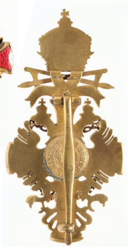
A Ferenc József Rend tisztikeresztje hadidíszítménnyel, kardokkal (előlap és hátlap, HIM Numizmatikai Gyűjtemény)