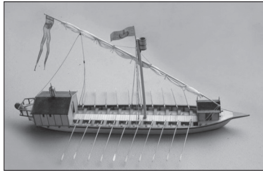
Dunai naszád a XVI. században (Közlekedési Múzeum, makett)