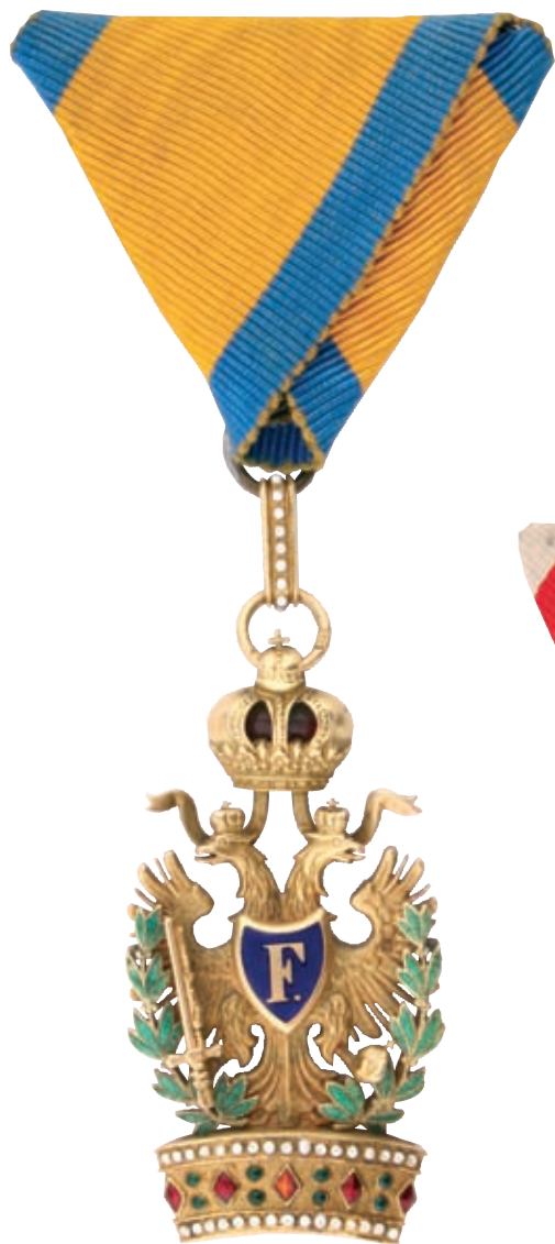
A Vaskorona Rend III. osztálya hadidíszítménnyel (HM HIM Numizmatikai Gyűjtemény)