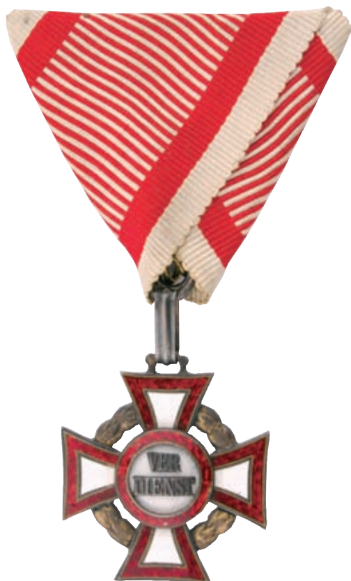
A Katonai Érdemkereszt III. osztálya hadidíszítménnyel (HM HIM Numizmatikai Gyűjtemény)