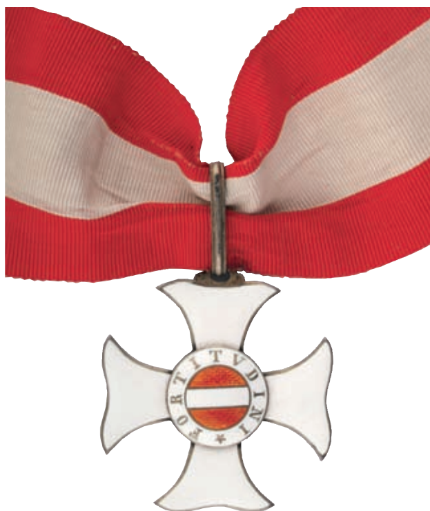
A Mária Terézia Rend parancsnoki keresztje (HM HIM Numizmatikai Gyűjtemény)