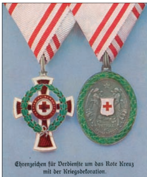
A Vöröskereszt II. osztályú Díszjelvénye és Ezüst Díszérme korabeli propaganda-képeslapon (magángyűjtemény)