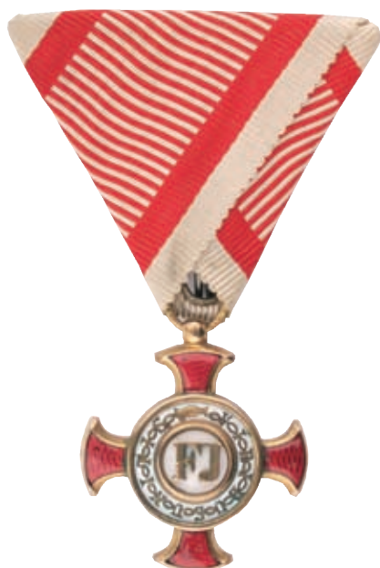
Arany Érdemkereszt hadiszalagon (HM HIM Numizmatikai Gyűjtemény)