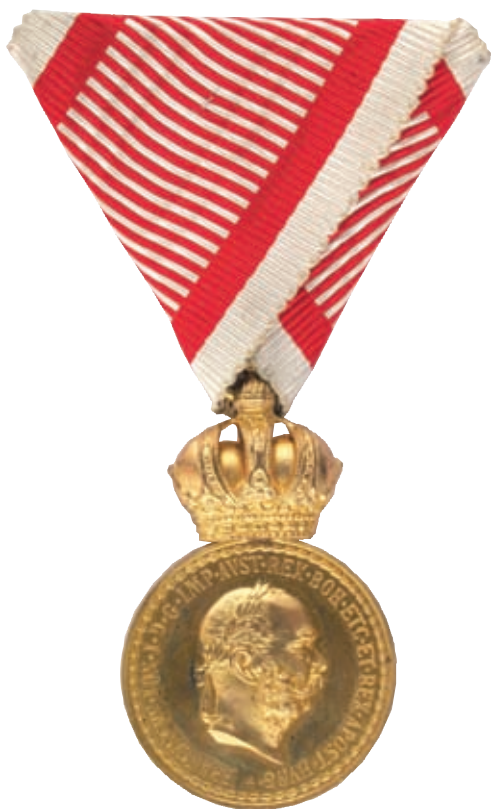
Bronz Katonai Érdemérem hadiszalagon (HM HIM Numizmatikai Gyűjtemény)