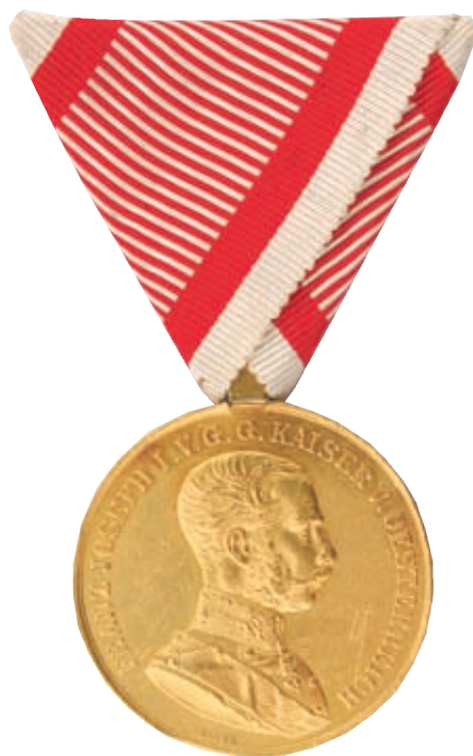
Az Arany Vitézségi Érem 1866-os, az első világháború kezdetén is adományozott típusa (HM HIM Numizmatikai Gyűjtemény)