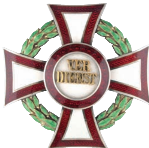
A Katonai Érdemkereszt I. osztálya hadidíszítménnyel (HM HIM Numizmatikai Gyűjtemény)