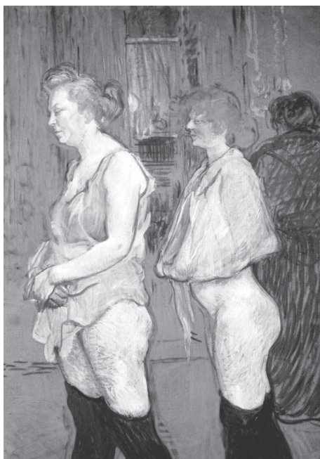
Henri Toulouse-Lautrec: Orvosi vizsgálat a bordélyban, 1894.

portalakító hatása, lakói mégsem azonosulnak a hozzá kötődő elvekkal, normákkal, szemlélettel, értékrenddel. Együttlétük a kívülről érkező nyomáshoz alkalmazkodik. A szerző konklúziója az, hogy a társadalom által megteremtett és működtetett, változatlan prostitúciós lehetőségek miatt tűnhetnek a prostituáltak egységes csoport tagjainak. A prostituált társadalmi kategóriáját az ellenőrzés és a szabályozás termeli ki újra és újra, ezért a szubkultúra kifejezés alkalmazása itt pontatlan és félrevezető volna. Helyette az élethelyzet kategóriáját javasolja, amely rávilágít a városi környezet konstitutív szerepére is: