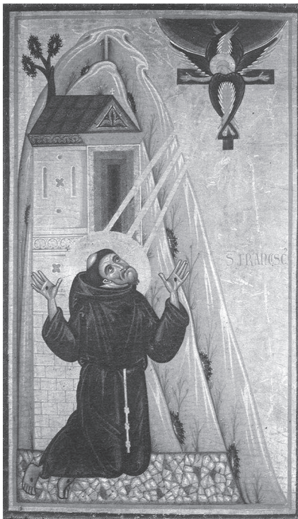
4. Szent Ferenc stigmái. Firenze, Uffizi, XIII. század közepe

A legkorábbi ábrázolás (1235) Bonaventura Berlinghieri pesciai oltárképének egy részlete. A „Krisztus az Olajfák hegyén” ikonográfiai konvencióját követve mutatja be a jelenetet – ez jól illik az alter Christus -elképzeléshez. Azt is megfigyelhetjük, hogy szinte áthatolhatatlan távolság választja el a térdelő Ferencet a felette lebegő szeráf-feszülettől (1. kép). Az angol Mathew Paris Chronica majora című műve 1236-ban egy másik konvencióhoz fordult: az álomlátomáshoz (2. kép) (ott szemlátomást csak hallomásból ismerték Celanói Tamás legendáját) 46 . A XIII. század közepi carpentrasi óraskönyv a vad természet és a hegy helyett egy kápolnába helyezi a színteret, ahol a szeráf egy oltáron áll (3. kép). A firenzei Bardi-kápolna mestere a ferences renden belüli radikális ellenzék, a Spirituálisok értelmezését közvetíti, ahol a szeráf-tól Ferenchez áramló három fény sugar Ferenc megvilágosodását és a látomás fontosságát hangsúlyozza, mely azután belülről átalakítja Ferenc testét. (4. kép) 47