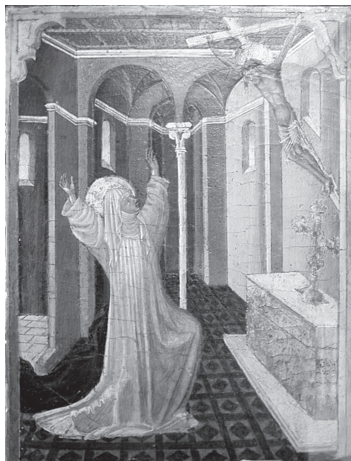
9. Giovanni di Paolo, Sienai Szent Katalin stigmatizációja. 1464 k. New York, Metropolitan Museum of Arts

gálták éveken keresztül. Amikor azonban patrónusa, Ercole d’Este herceg 1505-ben meghalt, Lucia csilgala leáldozott: a Savonarola-követő radikálisokkal szembe forduló Domonkos-rend új vezetése leállította a Lucia körül kibontakozó kultuszt, leváltotta a ferrarai kolostor vezetéséről, teljes elzártágra ítélte, és ekkor stigmái is „csodás módon” eltűntek. 86 Lucia nem az egyedüli „új Sienai Szent Katalin” volt: a XV. század végén egy egész sor stigmatizált „élő szent” ( santa viva ) jelent meg az itáliai városokban és feje-