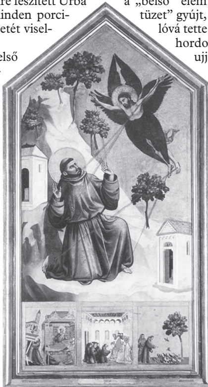
5. Giotto: Szent Ferenc stigmatizációja. Párizs, Louvre, 1300 k.

volt. Három alkalommal festette meg Szent Ferenc stigmatizációját. Mindhárom műben Bonaventúra felfogása érvényesült: egy természetfeletti, stilizált szeráf-feszület helyett e képeken embernagyságú Krisztus jelenik meg Ferencnek, akivel ő majdhogynem egyenrangú partnerként néz szembe. Az Assisi Szent Ferenc-bazilikában, a Chiesa Superiorében található freskó (1390 körül), a Louvre-ban őrzött pisai oltárkép (1300) (5. kép) 58 és a firenzei Santa Croce Bardi-kápolnijában festett freskó (1320 k.)