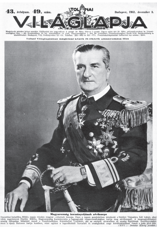
A Tolnai Világlapja 1941. december 3-i számának címlapja. A lap abban az évben így tisztelgett a „nemzet vezére” előtt Miklós-nap alkalmából

egy misztikus, halhatatlan teste. Az utóbbi köré szerveződött az egyház ( corpus Christi ). 30 Az egyház misztikus testének a feje természetesen Jézus Krisztus, a