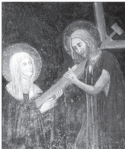
6. Montefalcói Klára látomása. Montefalco, Chiesa di S. Chiara, XIV. sz.

Ez a racionális értelmezés tulajdonképp a sebek „pszichoszomatikus” eredetét vetette fel (egyúttal megkérdőjelezve természetfeletti eredetüket) – nem csoda, hogy a ferencesek ingerülten tiltakoztak ellene. 1320-ban egy Pierre Thomas nevű ferences magiszter a Párizsi Egyetemen egy külön „quodlibet-vitát” rendezett annak bizonyítására, hogy Szent Ferenc stigmái nem lehettek „természetes” eredetűek („non potuit habere stigmata per naturam”). 67