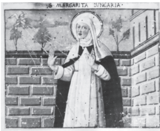
8. Pier Francesco Fiorentino, Árpád-házi Szent Margit stigmatizációja. Részlet egy táblakép predellájáról, San Gimignano, San Agostino, 1496.

Mindenek ellenére, miután 1461-ben az ugyancsak sienai II. Piusz pápa szentté avatta, még további másfél évszázadot kellett küzdeniük a domonkosok-