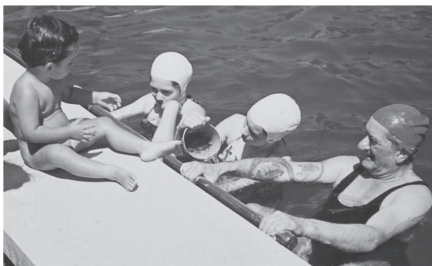
Horthy Miklós családjának néhány tagjával a kenderesi úszómedencéjükben. A képen jól látható az 1892–1894-es világtörő újtá során szerzett – sárkányt ábrázoló – tetoválása

1940-ben „a magyar sport legfőbb patrónusaként” méltatták rövidebb cikkekben egyes napilapok sportrovatában. 44 Ez érthető, mert a propaganda a gazdaságpolitikától kezdve a külpolitikán át egészen az oktatáspolitikáig minden sikert, eredményt az államfő nevével hozott kapcsolatba. A sportban is, amely a magyar „újjászületés” szempontjából is kiemelt jelentőségre tett szert, miután ugyanis „a trianoni békeparancs még a fegyvert is eltiltotta a magyar öklöktől, a sportban jutott kifejezésre minden magyar férfias erény: bátorság, elszántság, szívósság, keménység, élni akarás”. 45