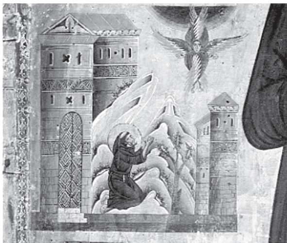
1. Bonaventura Berlinghieri: Szent Ferenc csodái (részlet). Pescia, San Francesco, 1235.

A testiség megnyilvánulásainak és megítélésének történeti és pszichológiai vizsgálatához a hetvenes évektől kezdve jelentősen hozzájárultak azok a kutatások, amelyek az „Igét megtestesítő” ( verbum caro factum est ) Krisztus testéhez fűződő vallási jelenségeket – némiképp szentségtörő módon – a test történetével foglalkozó „új történetírás” eszközeivel elemezték. Valóságos botrányt váltott ki Leo Steinberg amerikai művészettörténész The Sexuality of Christ in Renaissance Art and in Modern Oblivion című könyve 1983-ban. 18 A víziókban csodásan „életre kelő”, a kereszten megmozduló, szenvedő és a hozzá imádkozó misztikusokat megáldó, átölelő megfeszített Krisztus egyik modern spanyol példáját, a limpsiai mozgó feszület történetét dolgozta fel William A. Christian antropológus. 19 Hasonló esetek sorát elemzi David Freedberg The