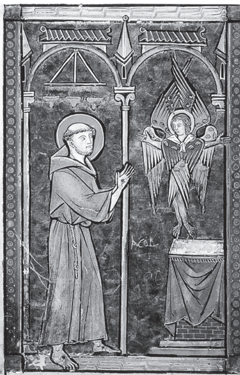
3. Szent Ferenc stigmái. Hóraskönyv. Carpentras, Bibliothèque Inguimbertaine, ms 77, f. 180v, XIII. sz. közepe.

nem aszketikus vagy eksztatikus öncsonkításból keletkeztek, hanem, mint Cortonai Illés írta: „soha-nem-hallott csodát” kell tisztelni bennük. Hogy pontosan hogyan keletkeztek, azt persze nem lehetett tudni, mert Ferenc sohasem beszélt róla, ez volt az ő „nagy titka”, és a stigmatizációnak nem voltak szemtanúi. 42 Ferenc első legendáírója, Celanói Tamás adott elő-